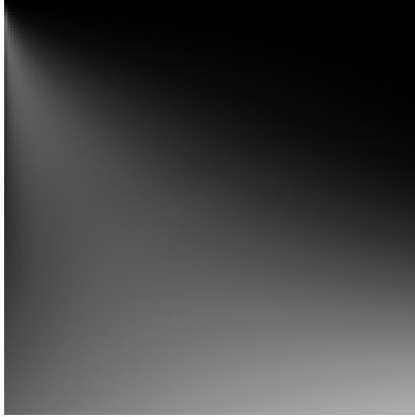
图 3: 关闭写入翻转, 预计算 1.0 - E(\mu)