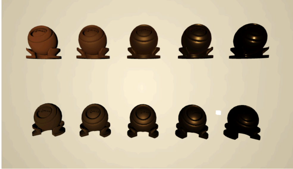
图 6: 使用 Kulla-Conty BRDF 补充微表面模型能量损失的材质