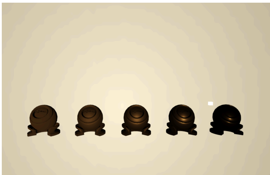
图 5: 使用微表面 BRDF 的材质

如果一切顺利，应该可以看到如下图所示的使用微表面 BRDF 材质的一排 Shading Ball：